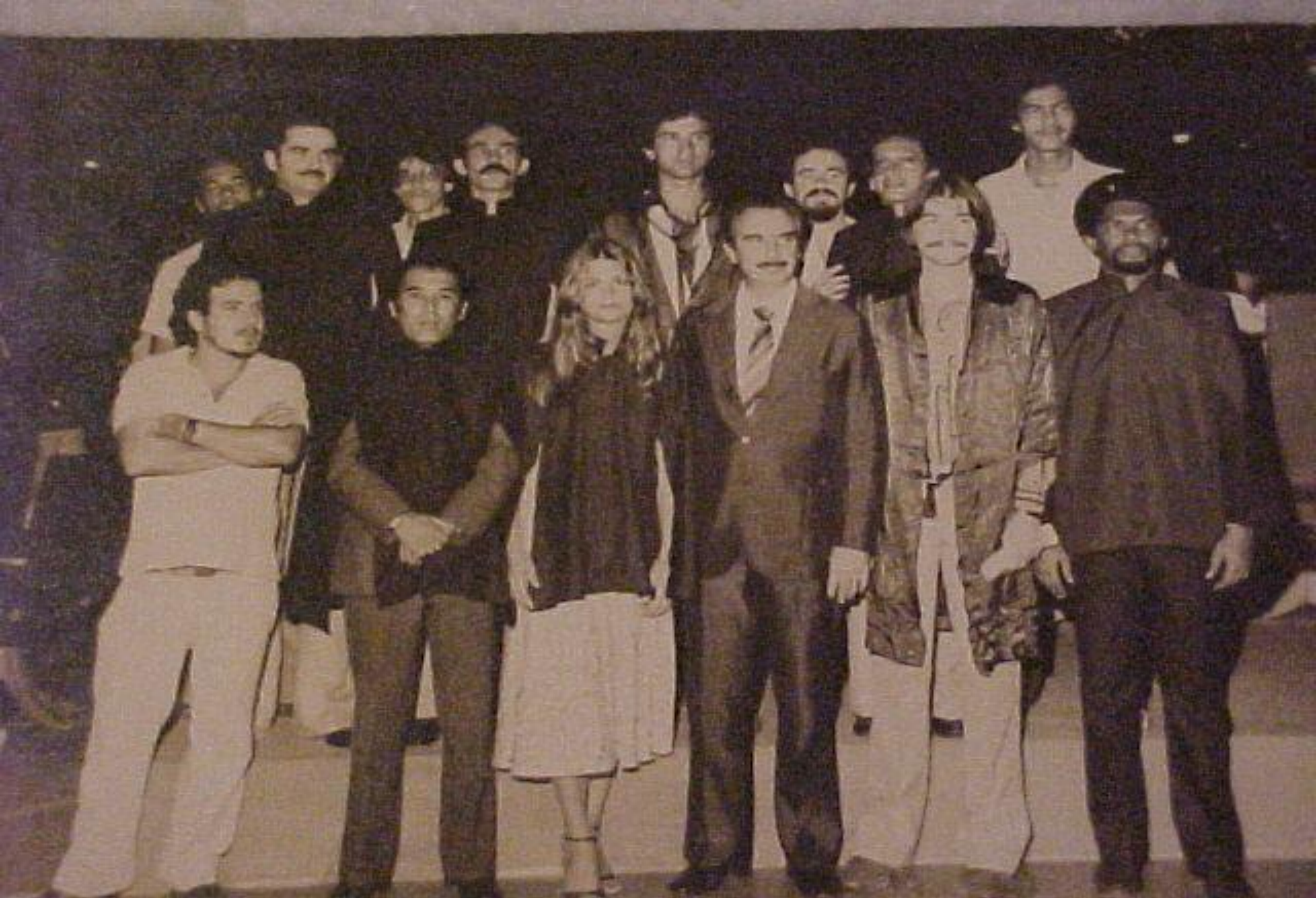
1ª Turma de Engenheiros Florestais da UFRPE -1979