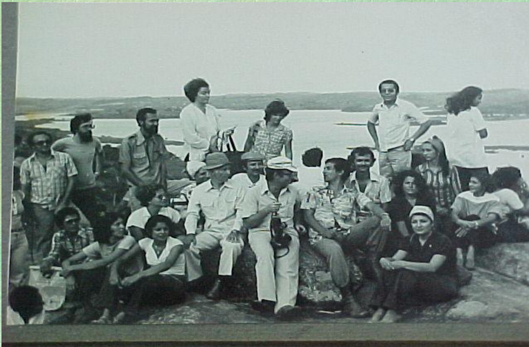
I Curso de Especialização em Ecologia do Nordeste - 1978